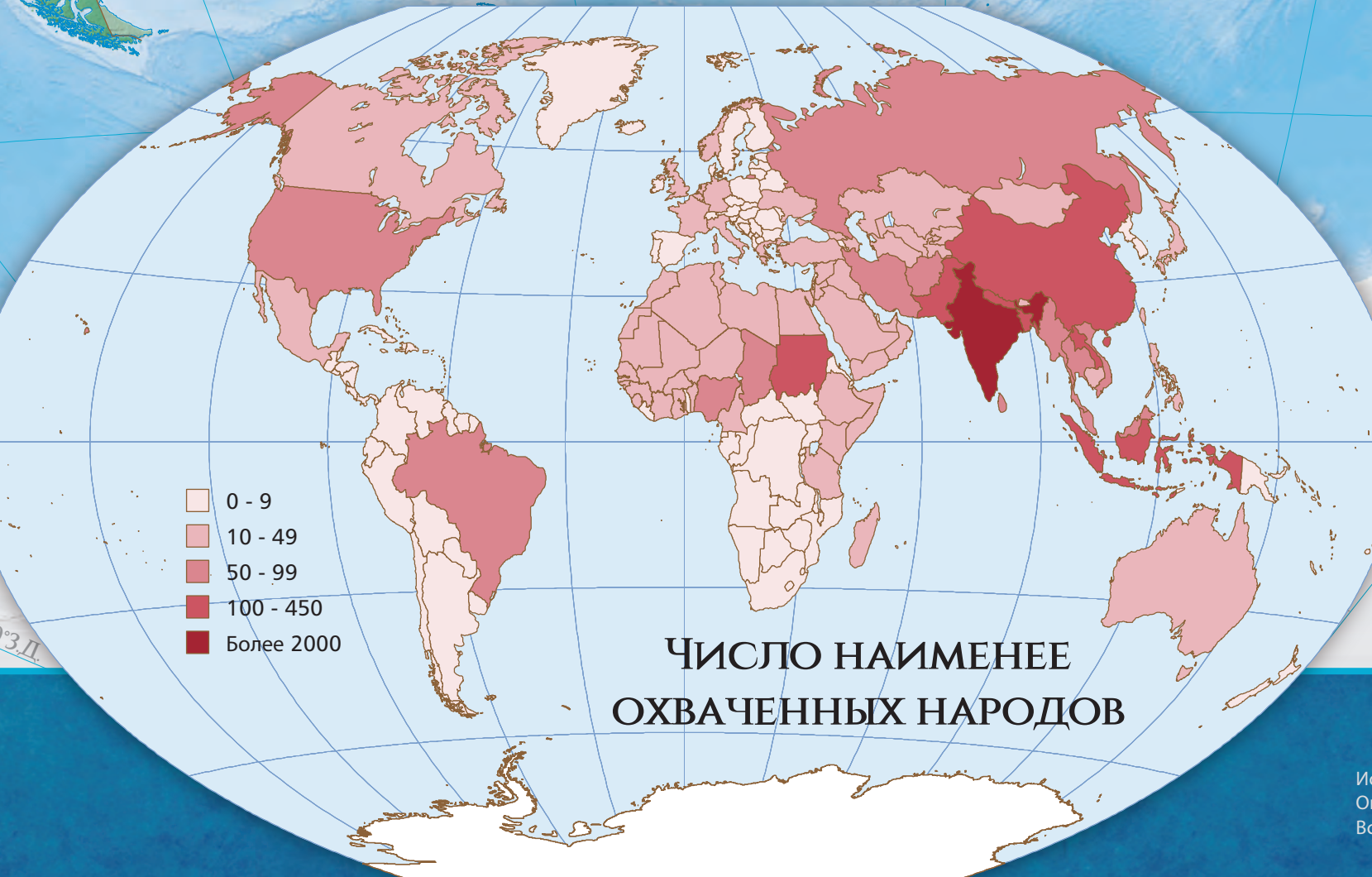
Число наименее охваченных народов

■ евангельский христианин ■ другой христианин ■ нехристианский