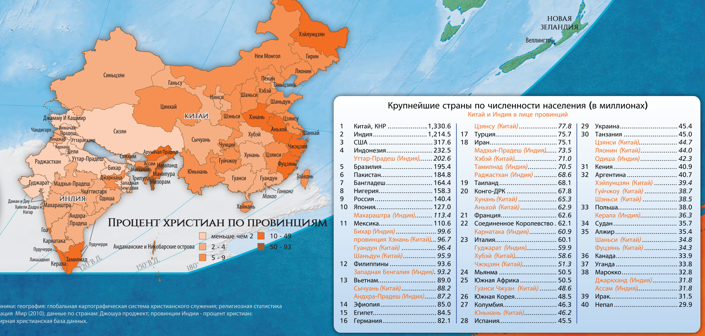
ПРОЦЕНТ ХРИСТИАН ПО ПРОВИНЦИЯМ

0 - 9 10 - 49 50 - 99 100 - 450 Более 2000